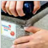
einfach zu öffnen über Eck easy to open