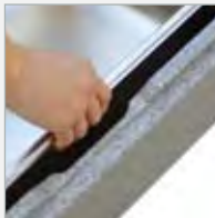
einfache Entnahme more space and special grips inside