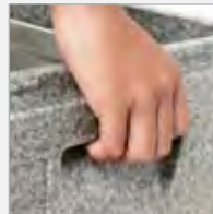
sichere Handhabung ergonomic handles