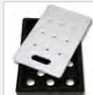
Kühlaufsatz und Kühlakku cooling top and cool pack